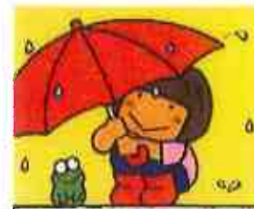
あめぼったん ひろかわさえこ